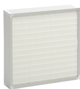
Filtermodul 2 (HEPA13)