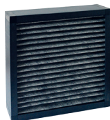
Filtermodul 3 (ACF)

Der Cairry ist standardmäßig mit Staubfiltern ausgestattet. Wenn Sie mit dem Luftreiniger auch Gerüche und Gase filtern wollen, dann benötigen Sie das Aktivkohle-Filtermodul.