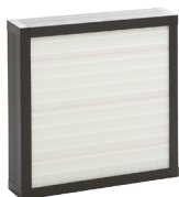
Filtermodul 1 (F7)